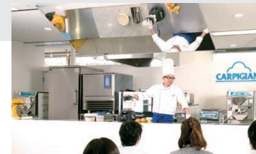
エフ・エム・アイによるセミナー

私たちは、外食ビジネス向けのトータルサポート機能を強化し、技術・ノウハウを高めるとともに新たな領域にも積極的に進出していきます。一例として2018年2月には、業務用の調理機器やコーヒーマシン、製菓機器等を輸入・製造・販売する(株)エフ・エム・アイがグループ入りしました。